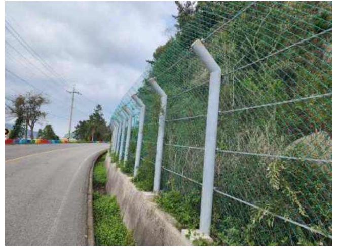
[사진 8] 이격거리