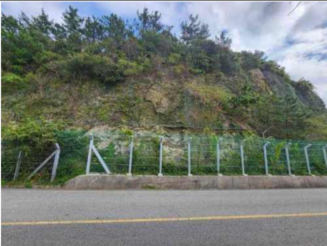
[사진 11] 종점부 현황