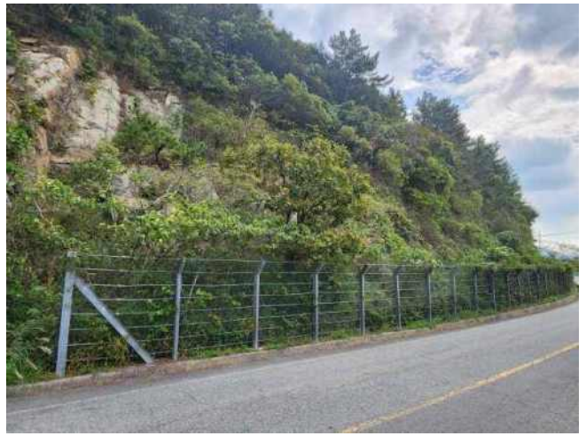
[사진 2] 급경사지 종점(좌측)