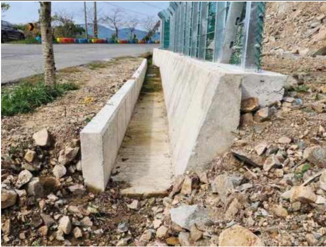
[사진 3] J형 수로