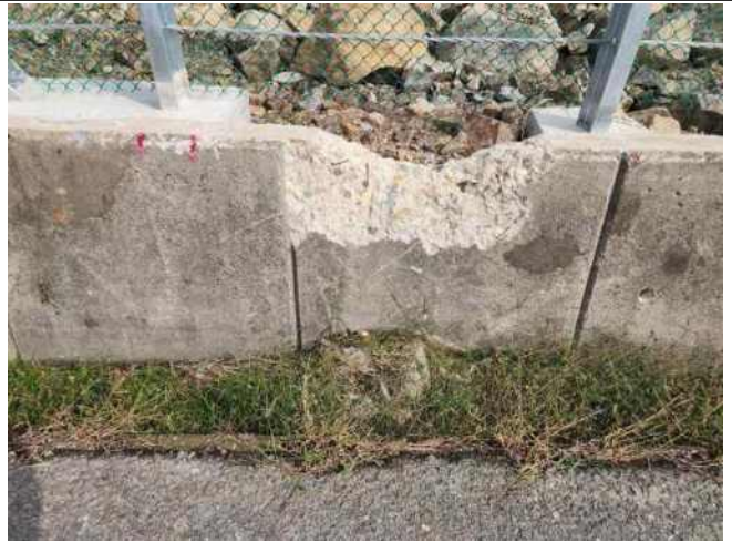
[사진 4] J형 수로 파손