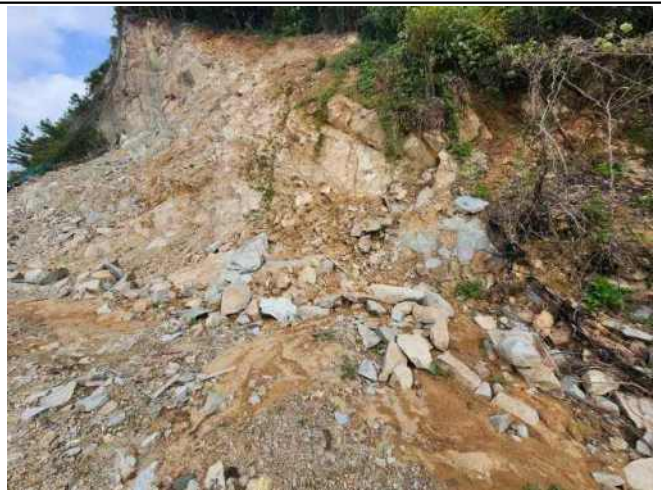
[사진 6] 시점부 현황