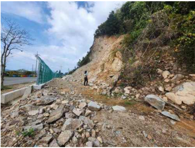
[사진 1] 급경사지 시점(우측)