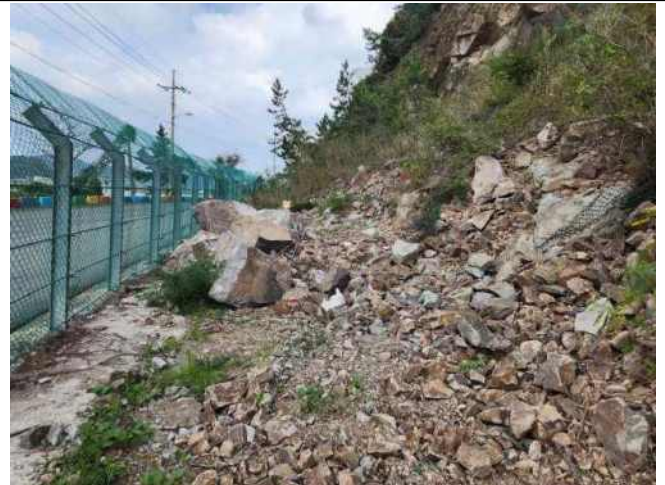
[사진 12] 중간부 낙석 현황