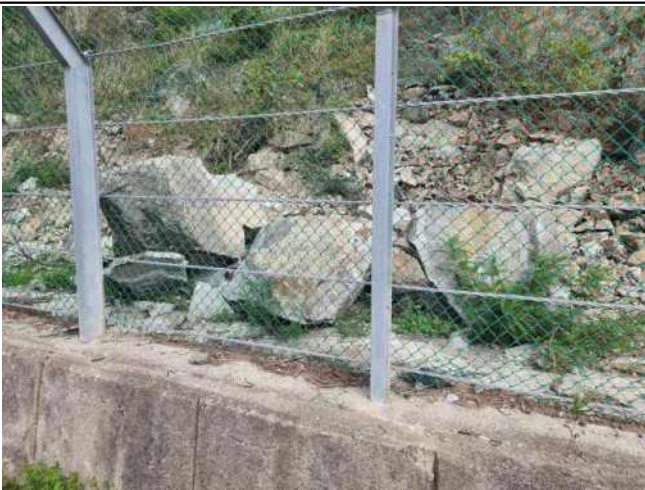
[사진 5] 낙석 현황