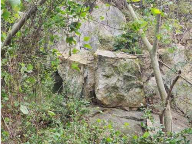
[사진 9] 종점부 뜬돌