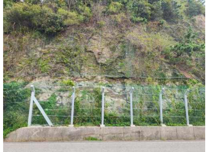
[사진 10] 종점부 이완암