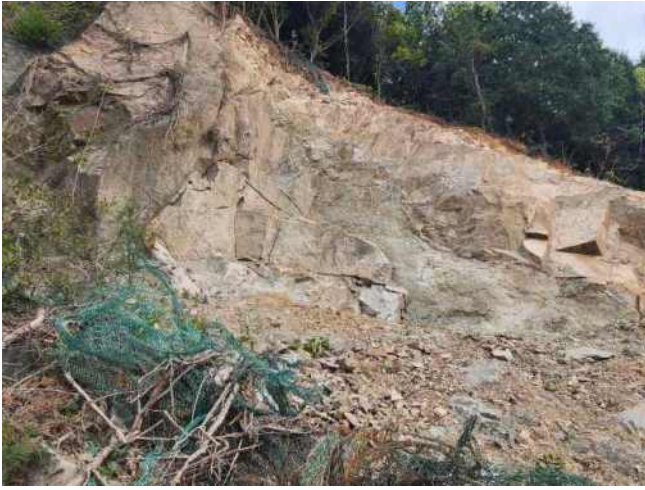
[사진 7] 암반사면 붕괴 현황