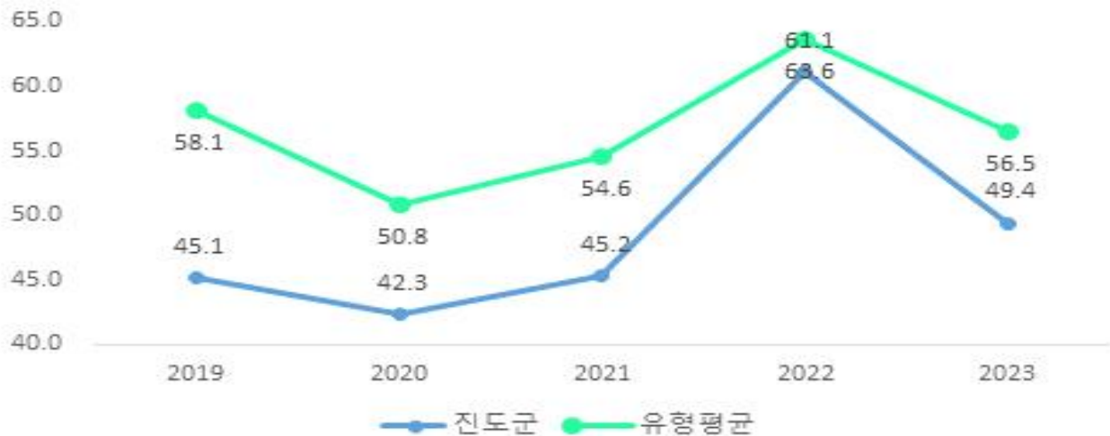
최근 5년 결산기준 재정자주도