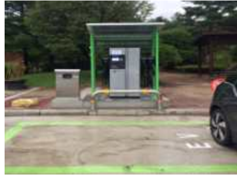
<충전시설 설치후 전경(실외)>