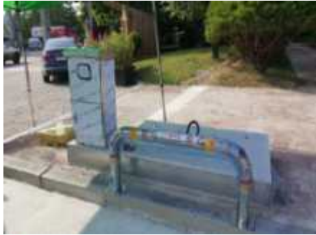
<충전시설 설치전 전경(실외)>