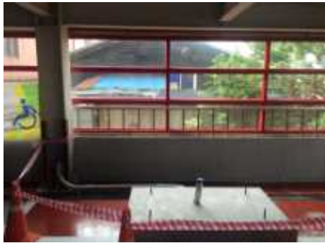
<충전시설 설치전 전경(실내)>