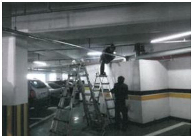
< 충전시설 설치사진 (실내) 예시 >