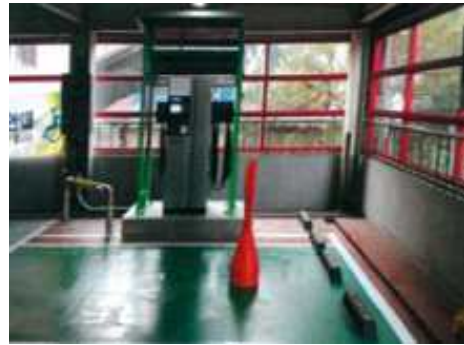
<충전시설 설치후 전경(실내)>

※ 그 밖에 전기자동차 충전설비의 설치에 관한 사항은 '한국전기설비규정(KEC)' 241.17 참조