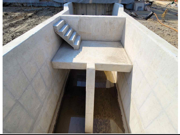
양수장 토출수조 시공중