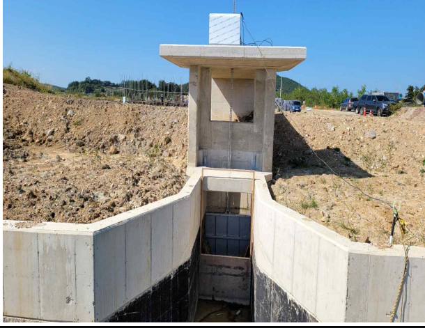
양수장 인입수문 시공중