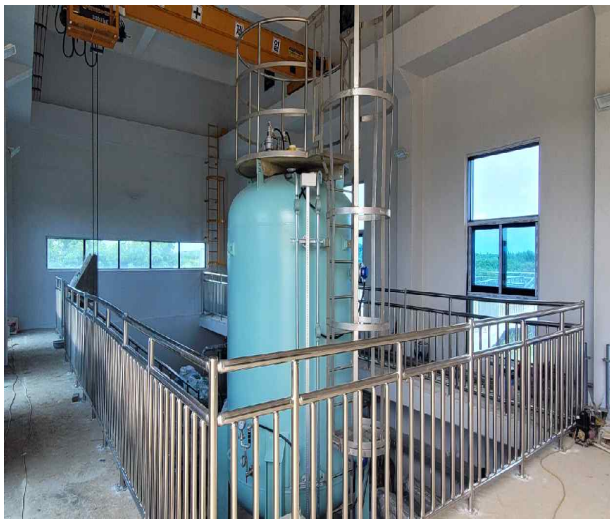
양수장 기계실 시공중