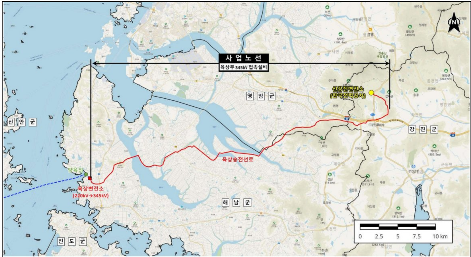
주) 송전선로 경과수(지)역은 추후 사업(설계 및 관련 인허가)추진 과정에서 변경 가능 (그림 1.4-2) 시역노선 위치도