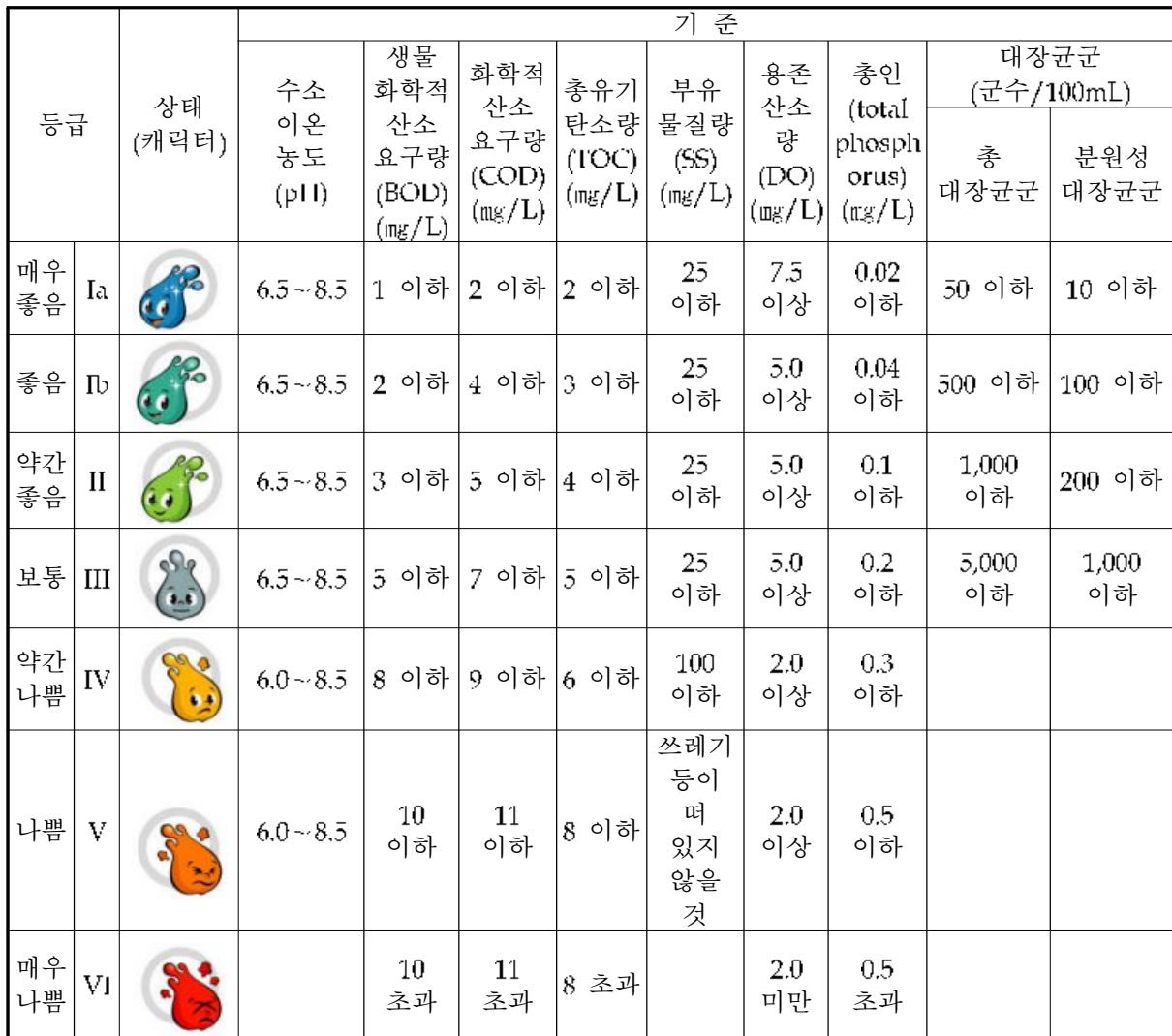
〈표 2.2-5〉 생활환경 기준 (하천)