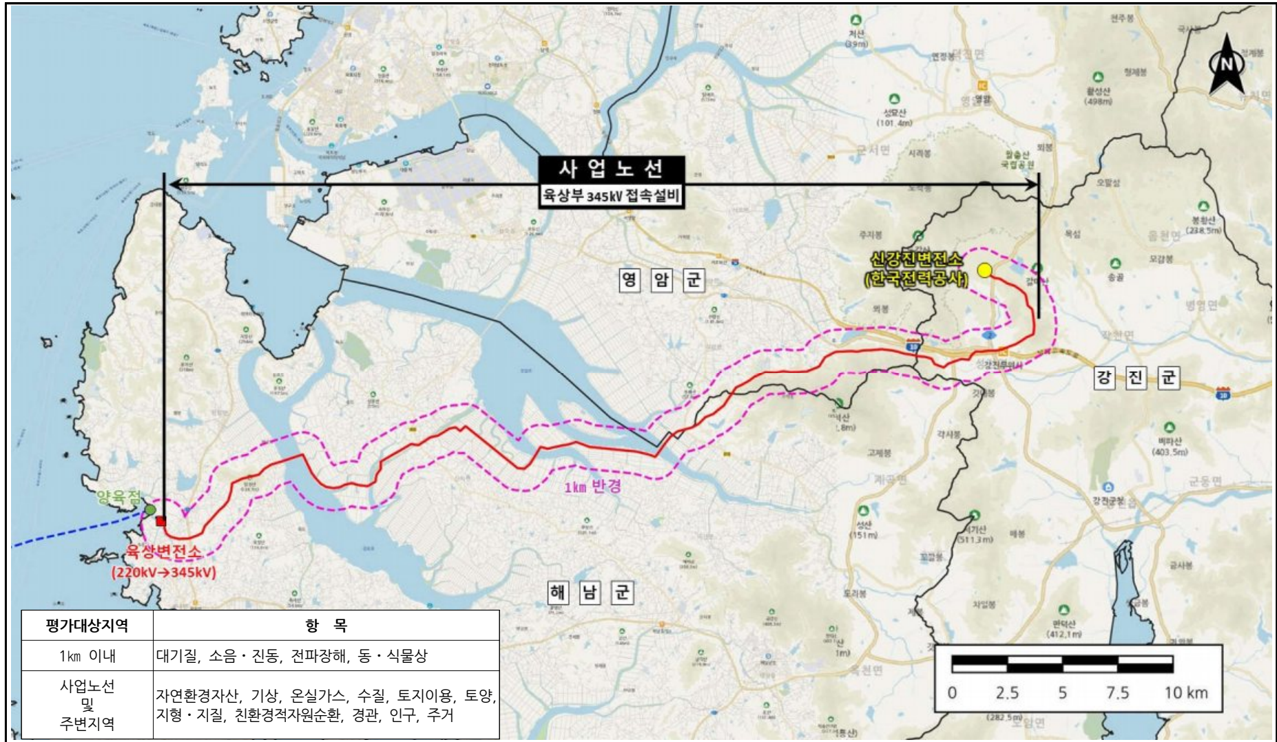
(그리 2.2-1) 환경영향평가 대상지역 설정도