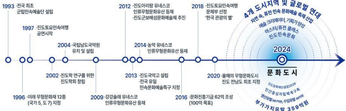
진도 문화예술사업 연도별 추진현황