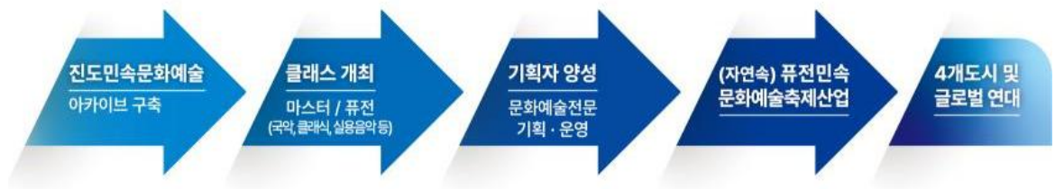
진도 문화도시 기본방향