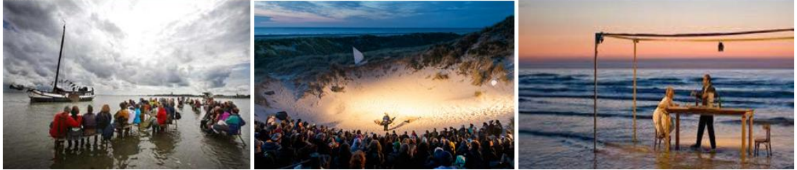
자연 속에서 향유하는 창의적 퓨전 민속문화예술 축제