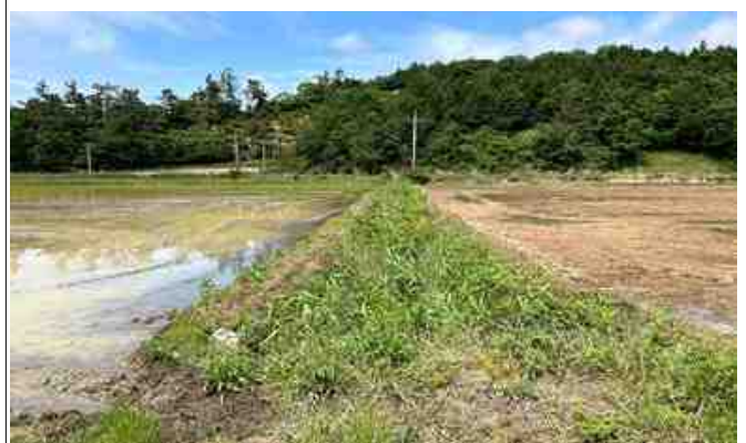
지구 내 배수로 전경