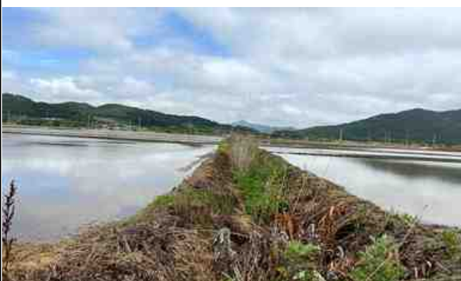
지구 내 배수로 전경