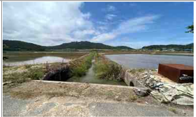
지구 내 배수로 전경