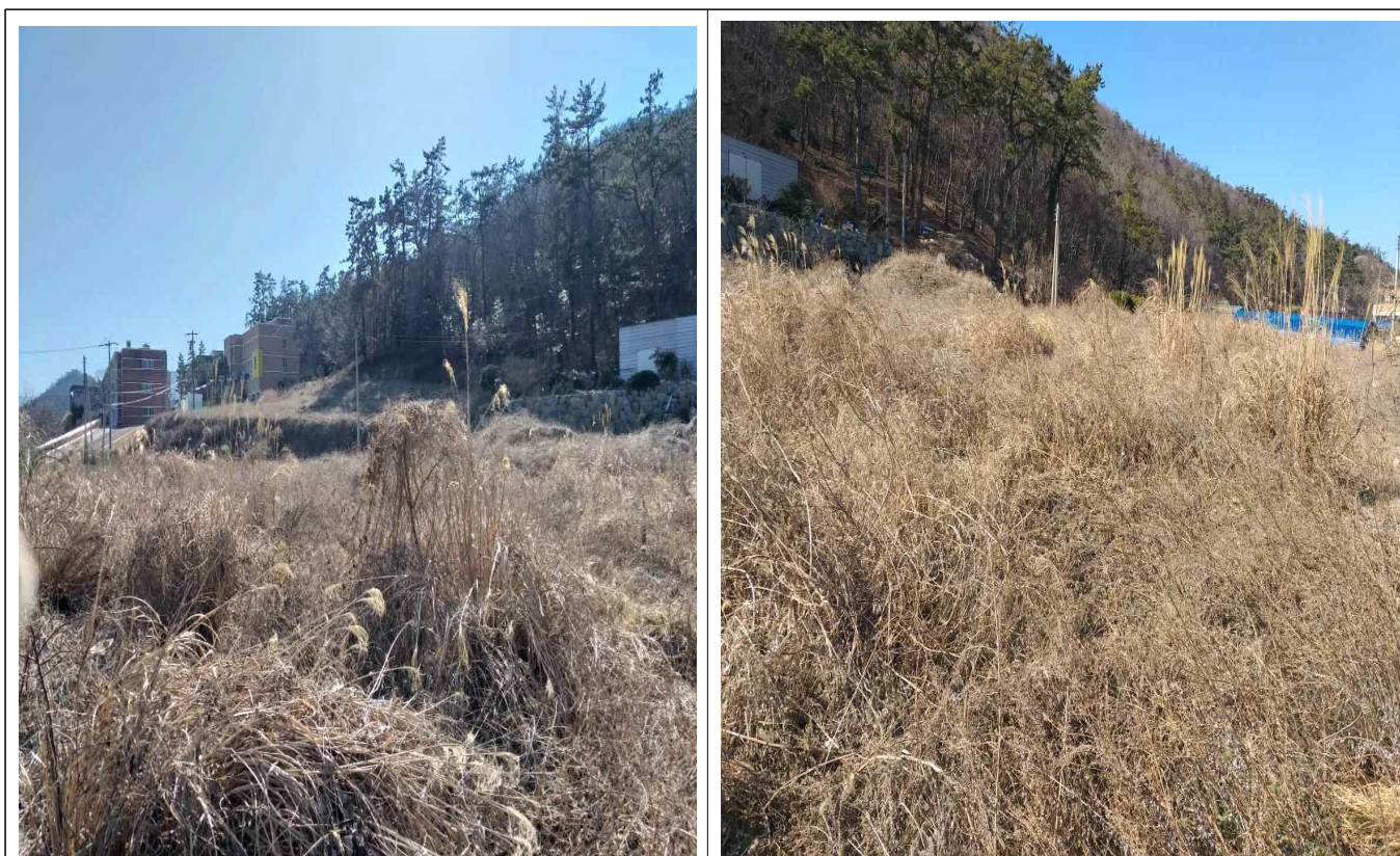
임회면 석교리 254 외 3필지