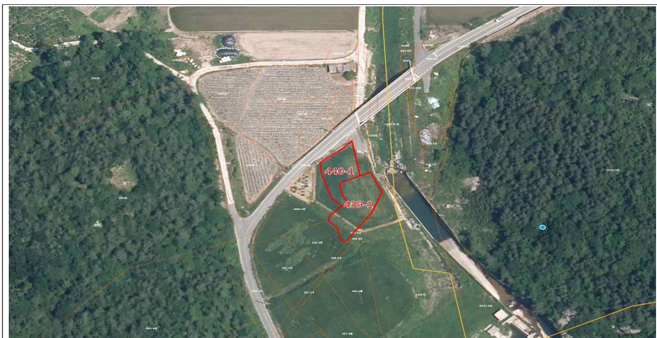
임회면 용호리 439-1 외 1필지