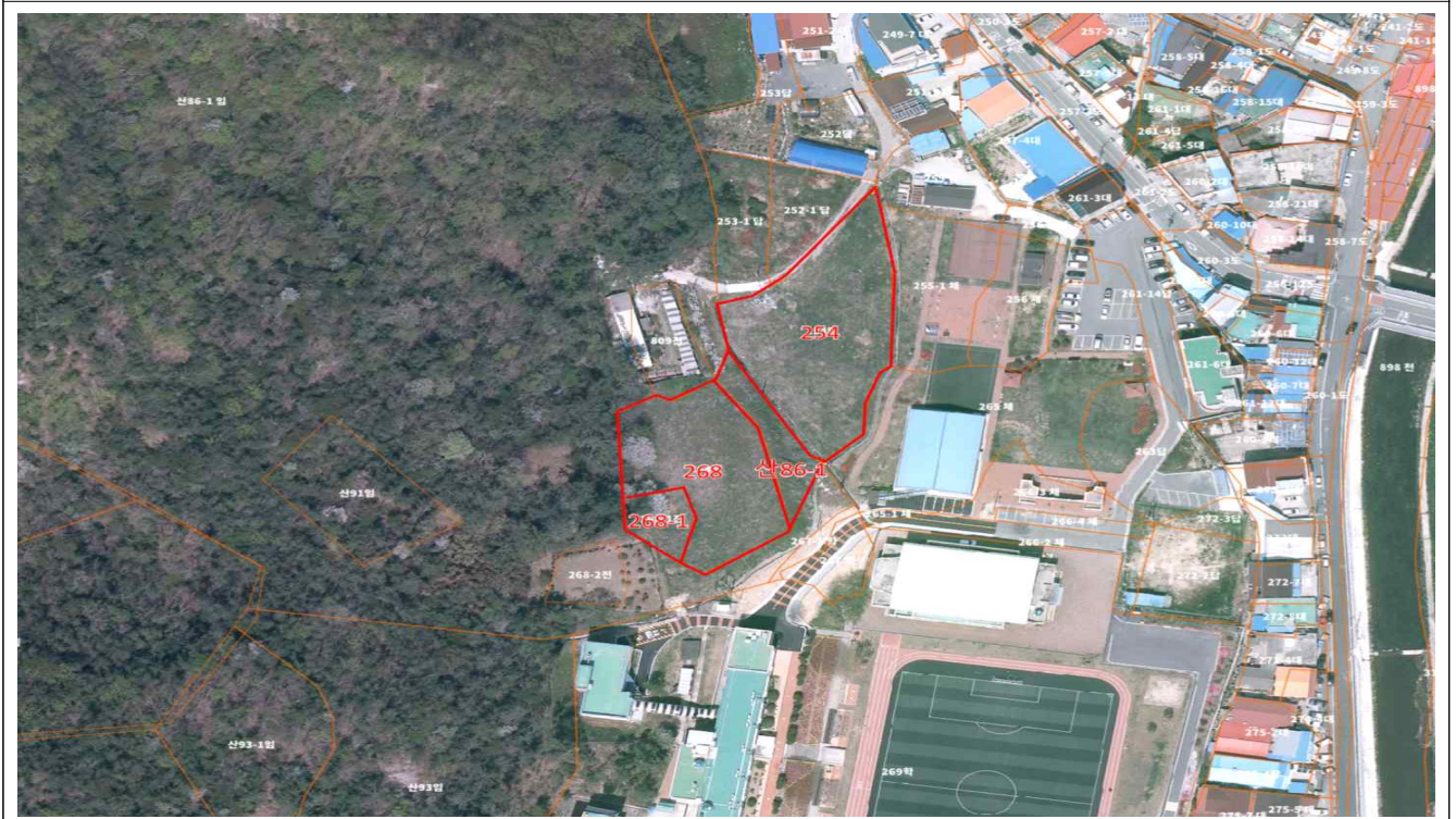
임희면 석교리 254 외 3필지