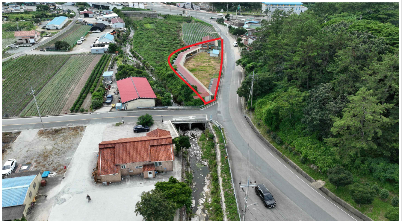
진도읍 동외리 1027 (답 / 1,374m 3 )