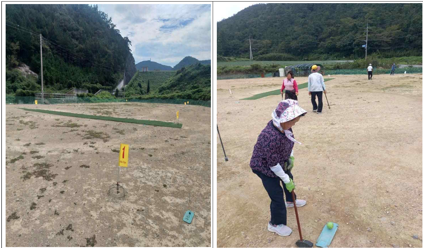
임희면 용호리 439-1 외 1필지