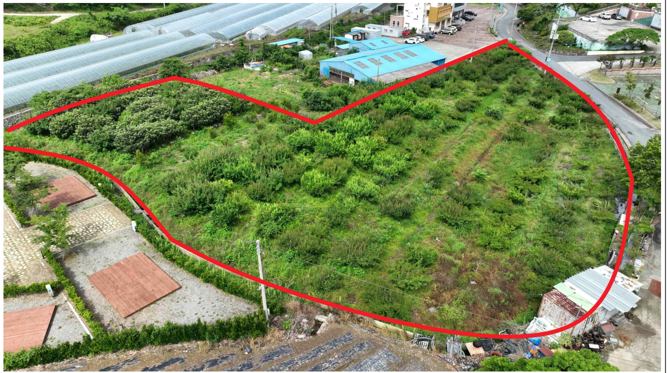
진도읍 동외리 268-1 (답 / 4,894m 3 )