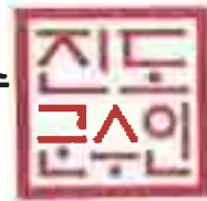
표 의 시 항