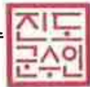
표 의 사 항