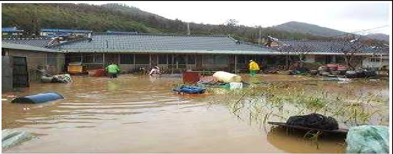
2012.8. 중류 가옥 침수