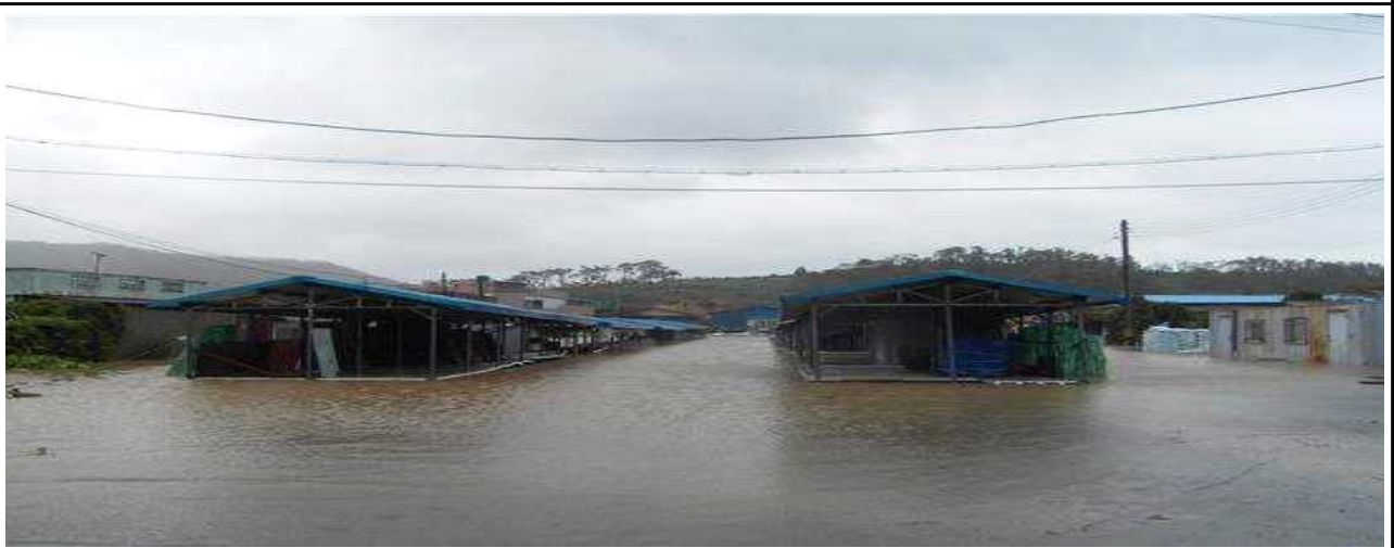
2012.8. 중류 시장 침수