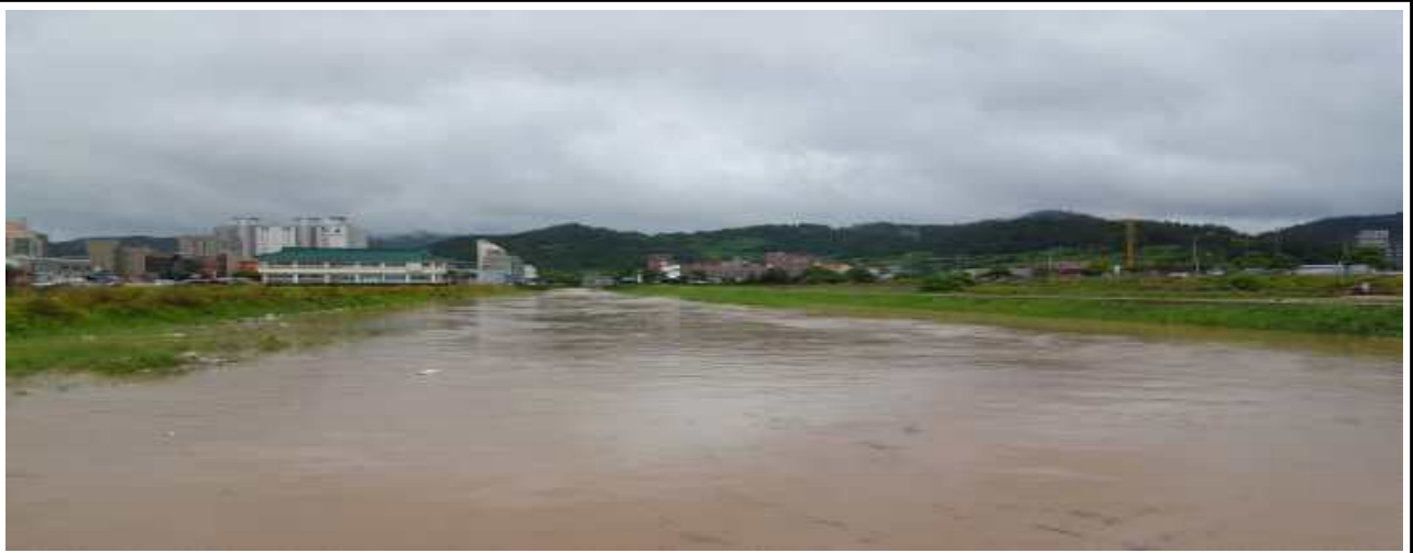
2019.6. 중류 농경지 침수