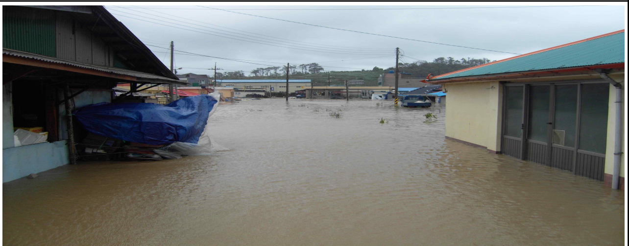
2012.8. 하류 가옥 침수