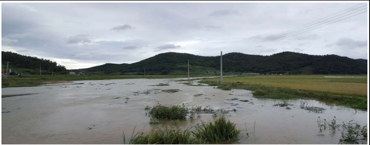
2019.10. 하류 농경지 침수