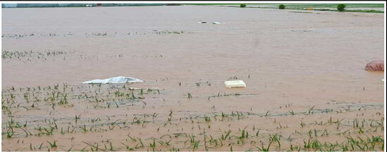
2012.8. 하류 농경지 침수