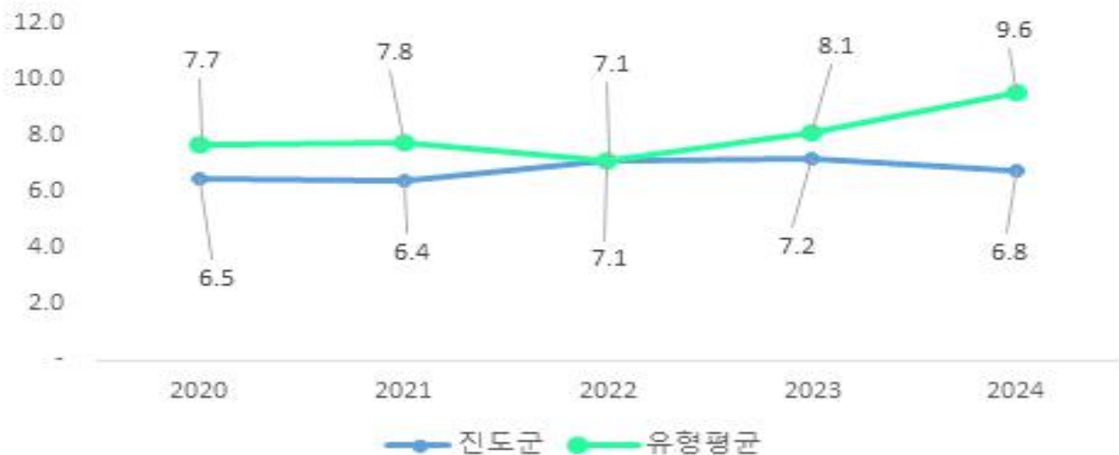
최근 5년 결산기준 재정자립도

※ '자체수입', '보전수입 등 및 내부거래' 및 '세입 합계'의 각 수치는 결산액에서 '전년도 이월 사업비'를 제외한 값입니다. 예산 기준 재정자립도 산정시 전년도 이월 사업비가 포함되지 않기 때문에 지표 간 비교를 위해 이를 제외하였습니다.